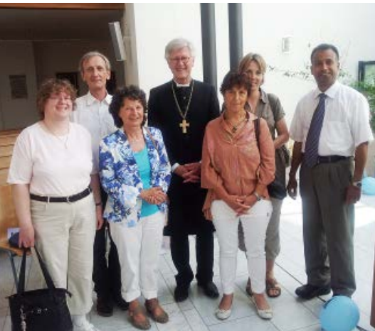
Die Vertretung der Erlöserkirche Chur mit Pfarrer Ulrich Gampert und Landesbischof Heinrich Bedford-Strohm in der evangelisch-lutherischen Erlöserkirche in Immenstadt im Allgäu.