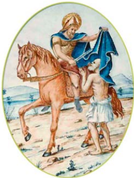
Hl. Martin, Schutzheiliger der Reisenden, der Armen und Bettler sowie der Reiter.

Am 1. und 2. November feiert die Kirche Allerheiligen und Allerseelen.