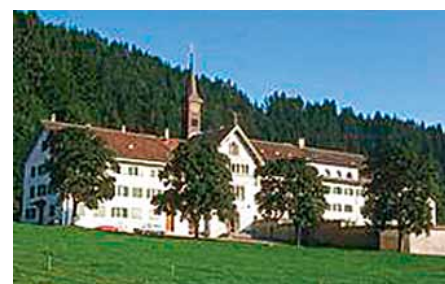
Benediktinerinnenkloster: Seit 150 Jahren ewige Anbetung. Ort der Stille und Meditation.

Das Benediktinerinnenkloster in der Au ist ursprünglich aus einer Waldschwestersiedlung entstanden. Es wurde 1359 erstmals erwähnt.