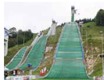
Sprungschanze in Einsiedeln